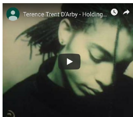
"Holding On To You" – dall'album "Vibrator" (1995)