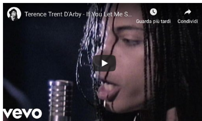
"If You Let Me Stay" – dall'album "Introducing the Hardline According to Terence Trent D'Arby" (1987)