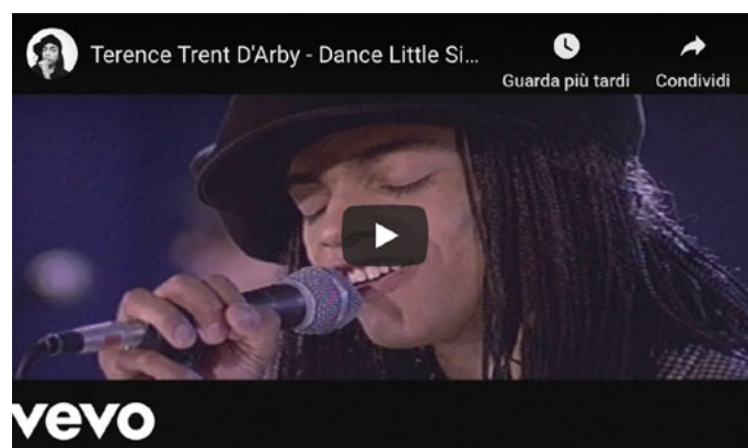
"Dance Little Sister" – dall'album "Introducing the Hardline According to Terence Trent D'Arby" (1987)

Il 15 marzo 1962 a New York nasceva Terence Trent Howard che nella sua prima emanazione si è trasformato in Terence Trent D'Arby e poi in Sananda Francesco Maitreya. Che Darby sia il cognome del padre adottivo, al quale, per vezzo d'artista, ha aggiunto un apostrofo poco importa. Quel che davvero è importante è che nel luglio 1987 pubblicava il suo primo album, una bomba: "Introducing the Hardline According to Terence Trent D'Arby". Un disco scritto quasi per intero da lui, parole e musica. Un disco di quelli che, una volta pubblicati, si è davvero orgogliosi del lavoro svolto.