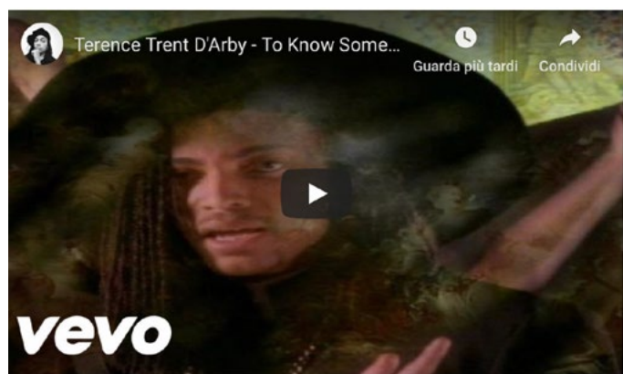
"To Know Someone Deeply Is To Know Someone Softly" – dall'album "Neither Fish Nor Flesh" (1989)