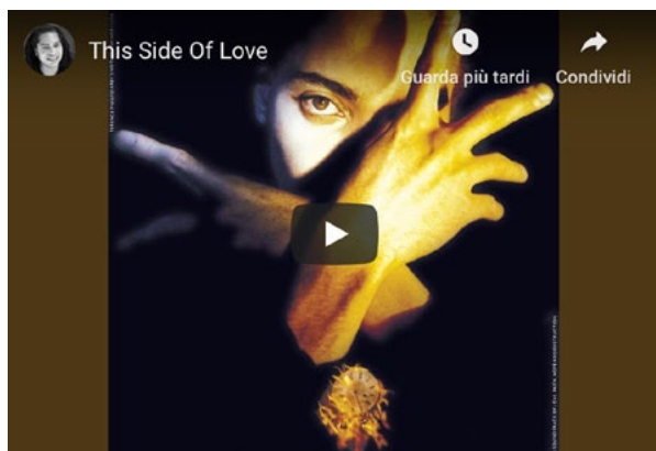
"This Side of Love" – dall'album "Neither Fish Nor Flesh" (1989)