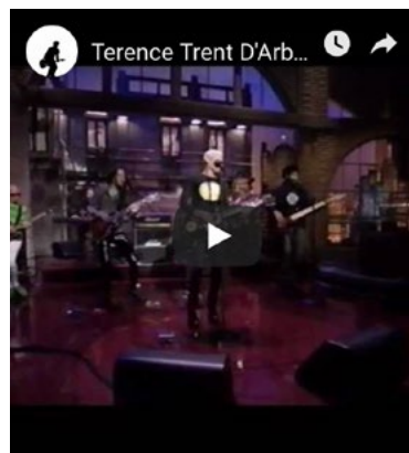
"Vibrator" – dall'album "Vibrator" (1995)