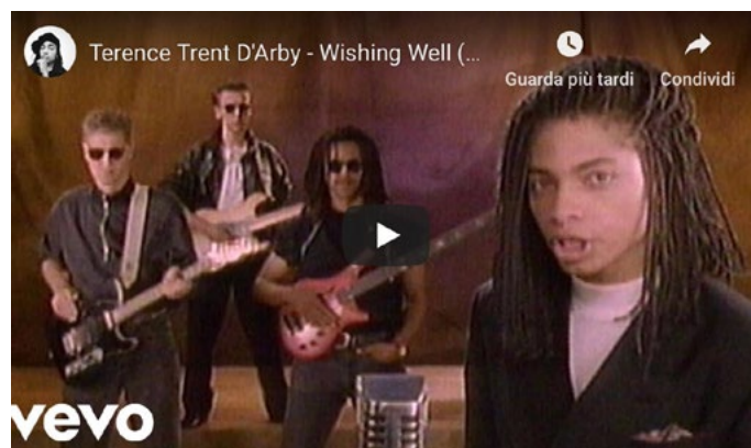
"Wishing Well" – dall'album "Introducing the Hardline According to Terence Trent D'Arby" (1987)