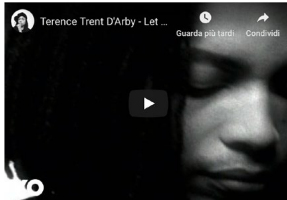
"Let Her Down Easy" – dall'album "Symphony or Damn" (1993)